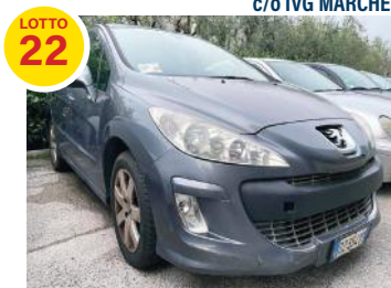
AUTOVEICOLO PEUGEOT 308 cc 1560, kw 66, gasolio € 1.900