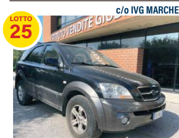
AUTOVETTURA KIA SORENTO cc 2497, kw 103, gasolio € 650