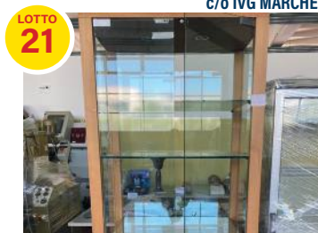
VETRINA A DUE ANTE con ripiani in vetro OFFERTA LIBERA