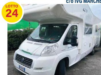
CAMPER FIAT RIVIERA cc 2287, kw 95,50 € 18.900