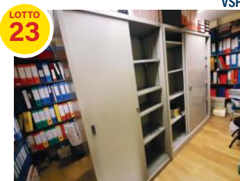
ARREDAMENTO VARIO PER ARCHIVIO € 761